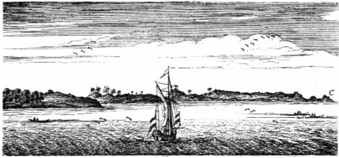
Nave negriera alla fonda presso Cabo tres Puntas, nella Costa di Guinea. (Barbot, Churchill)

sbarco all'altro. Il registro di bordo continua a riportare ottimi risultati: